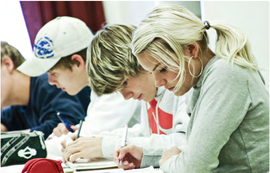
Uppteknir nemendur í Síðuskóla

Eitt af markmiðum sérdeildarinnar er að efla og styrkja félagsleg tengsl nemendanna við aðra nemendur skólans. Nemendur sérdeildarinnar eiga sinn tengslabekk. Lögð er áhersla á að samskiptan (blöndun) sé í samræmi við þarfir og getu hvers einstaklings og misjafnt er hversu mikið nemendur eru inni í bekk.