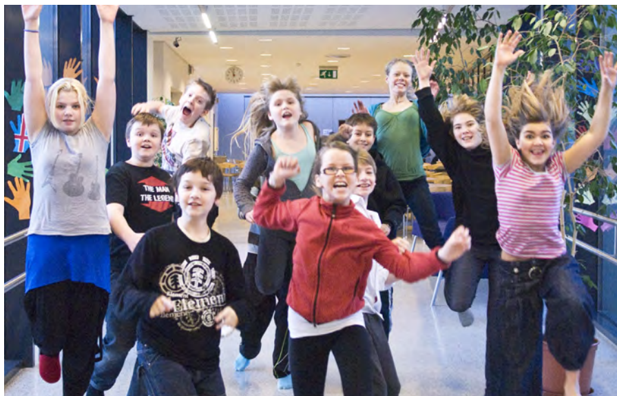
Brugðið á leik í Brekkuskóla

Skólinn er að marka sér umhverfisstefnu og leggur áherslu á umhverfismennt og útinám. Í upphafi og lok hvers skólaárs eru útidagar og þá fer kennslan að mestu fram utandyra og nánasta umhverfi skólans nýtt eins og kostur er. Dýrahald hefur reynst vel sem hluti af starfsemi skólans og er stefnt að því að reyna að auka þann þátt.