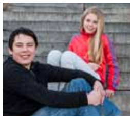
Vallaskóli bls. 4