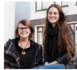
Tækniskólinn bls. 6