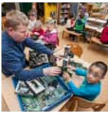
Leikskólinn Laugasól bls. 2