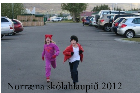
Norræna skólahlaupið 2012

Að miðla upplýsingum til forráðmanna barna í Síðuskóla. Þeir sem vilja koma upplýsingum í blaðið eru beðnir að senda tölvupóst á stjórnendur, oli@akureyri.is, olofi@akmennt.is., thorah@amennt.is. Þá eru vel þegnar ábendingar um það sem betur má fara. Blaðinu er dreift með tölvupósti til forráðamanna barna í Síðuskóla og er einnig birt á heimasíðu skólans, http://www.siduskoli.is Það mun koma út mánaðarlega.