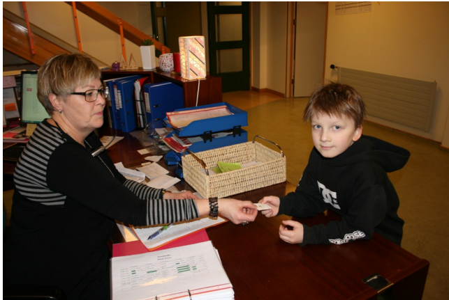
Miði afhentur af ritara skólans

Nú er SMT– 100 miða leiknum okkar lokið þetta árið. Tilgangur leiksins er að hvetja nemendur enn frekar til að fara eftir SMT-skólareglunum. Nemendur leggja sig fram um að sýna fyrirmyndarhegðun á öllum svæðum skólans og við það