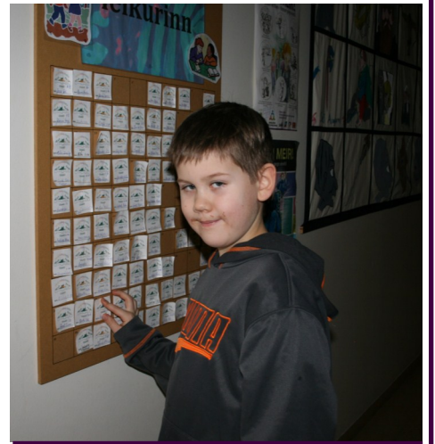
Miða komið fyrir á 100 miða töflunni.

og er ekki ósvipaður bingói þar sem allir eru með en aðeins nokkrir vinna. Vinningurinn felst alltaf í því að þeir 10 nemendur sem vinna gera eitthvað skemmtilegt með skólastjórnendum. Úrslit úr leiknum fara fram á sal þann 10. febrúar.